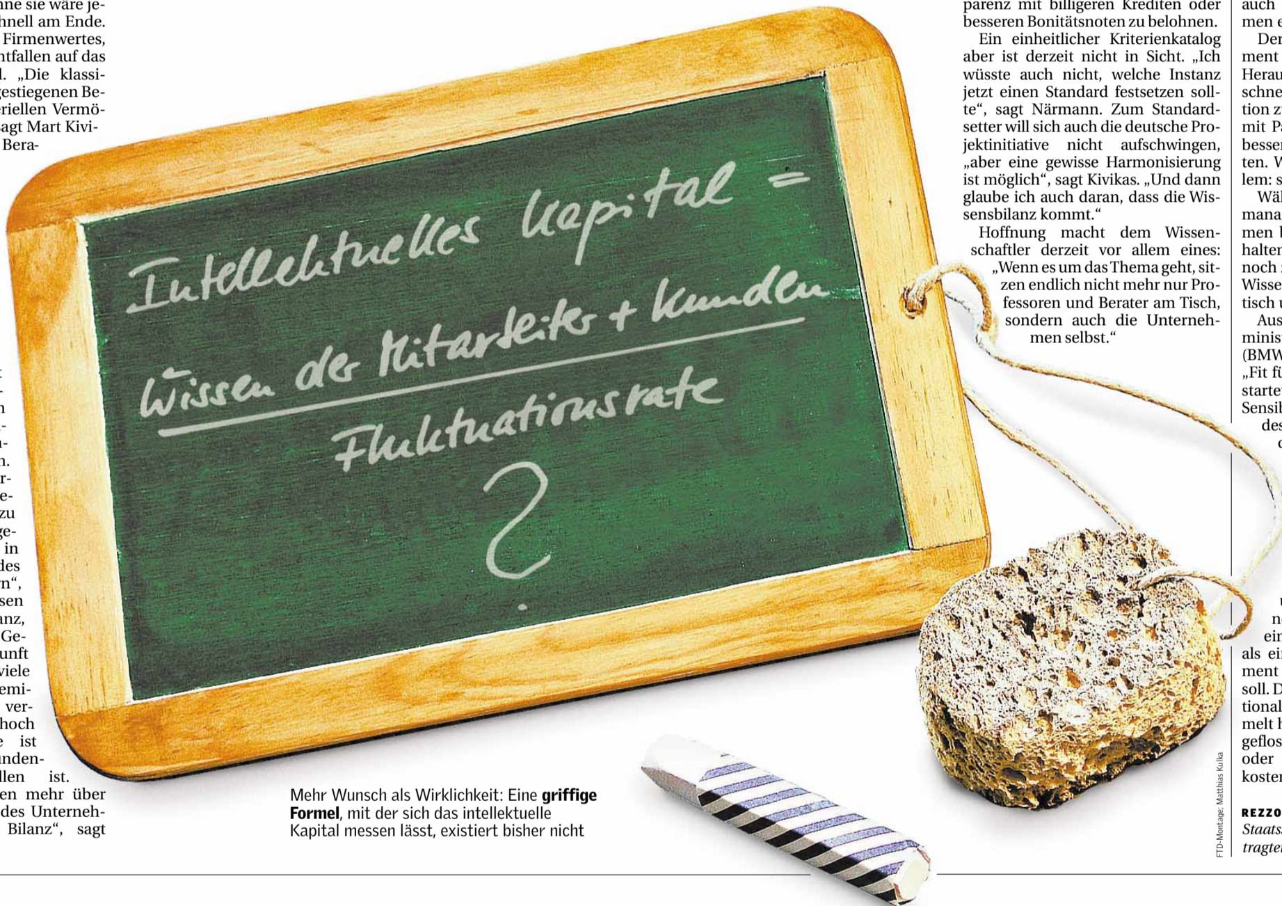
Mehr Wunsch als Wirklichkeit: Eine griffige Formel , mit der sich das intellektuelle Kapital messen lässt, existiert bisher nicht

REZZO SCHLAUCH ist Parlamentarischer Staatssekretär und Mittelstandsbeauftragter der Bundesregierung.